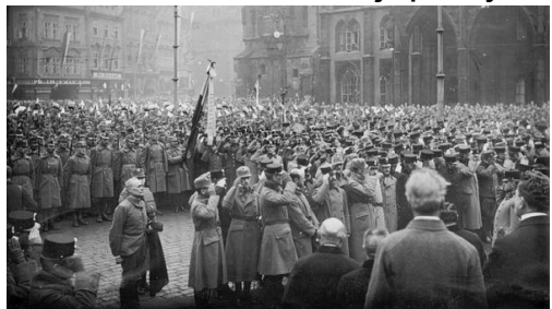
28. říjen – vojáci na Staroměstském náměstí přisahají věrnost novému státu.